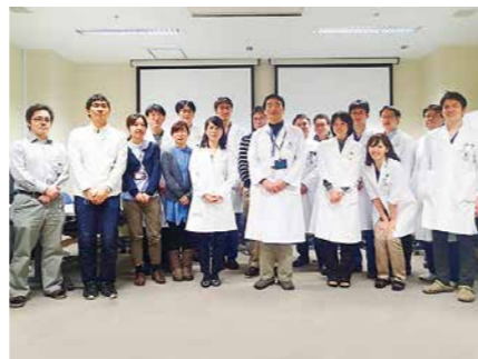
放射線診断科医局員