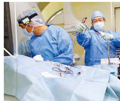
血管造影室でのCTガイド下ラジオ波焼灼術