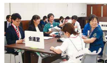
小児脳死臓器提供シミュレーション

これから臓器移植医療の支援活動を積極的に進めてまいりますので、ご協力宜しくお願いいたします。(臓器移植支援室/藤盛啓成)