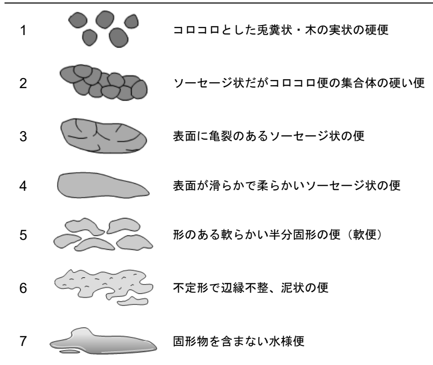
図 1) ブリストル便形状スケール