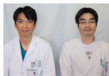
文責：井上 淳・金 笑奕（消化器内科）

（日本消化器病学会・日本肝臓学会 NAFLD/NASH診療ガイドライン2020より）